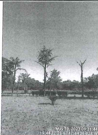
Palmeiras cariotas em final de ciclo biológico. SEMAM, 2023.