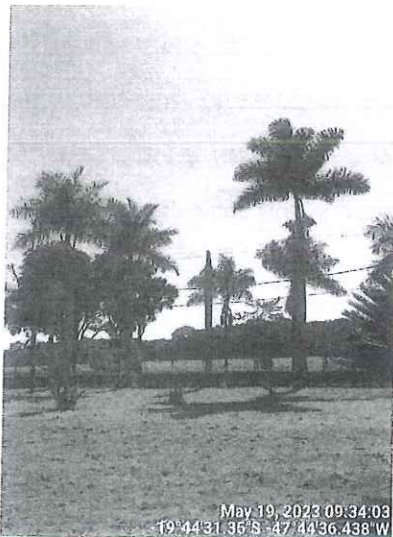
Estipe da palmeira coca-cola. SEMAM, 2023.