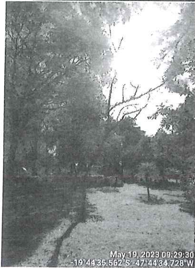
Chorão morto. SEMAM, 2023.