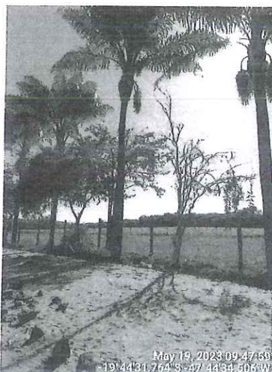
Resedás mortos alocados na divisa da via com o estacionamento. SEMAM, 2023.