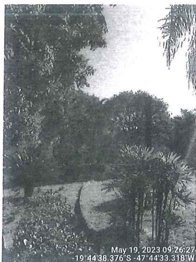
Estipes a serem desmontados. SEMAM, 2023.

Com base na Lei Complementar nº 389/2008 e no artigo 49 da Lei Federal nº 9.605/1998, tão logo ocorra o deferimento por parte do Conphau, esta Secretaria de Meio Ambiente irá emitir autorização para os desmontes relatados.