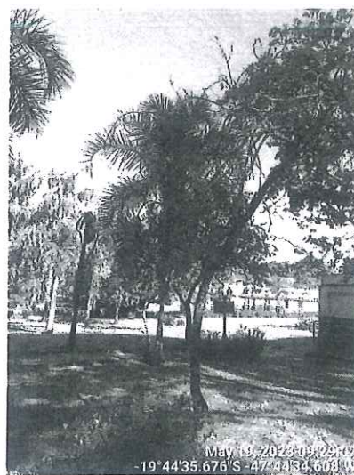
Chuva-de-ouro morta. SEMAM, 2023.